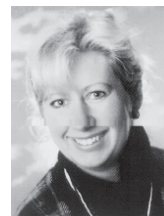
Bestatterin Trauerberaterin Freirednerin

Durch meinen umfangreichen Service liegt alles vertrauensvoll in meiner Hand. Gerne informiere ich Sie ausführlich über die Bestattungsvorsorge zu Lebzeiten!